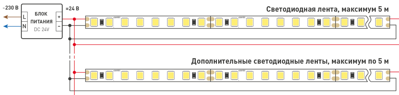
Схема 1. Подключение нескольких светодиодных лент с двух сторон.

Максимальная длина подключения ленты – 5 м (1 катушка).