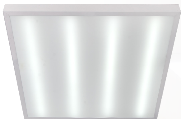
PPL SPEC1 OP