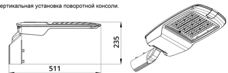
Угол регулировки поворотной консоли \pm 15^\circ с шагом 5^\circ .