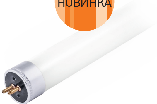
PLED T5-600GL 8w стеклянная колба