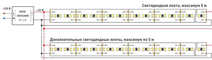
Схема 2. Подключение нескольких светодиодных лент с двух сторон. Рекомендуется использовать для обеспечения равномерного свечения ленты по всей длине.