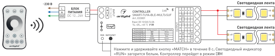
Рисунок 1. Схема подключения контроллера SMART-TUYA-BLE-MULTI-SUF